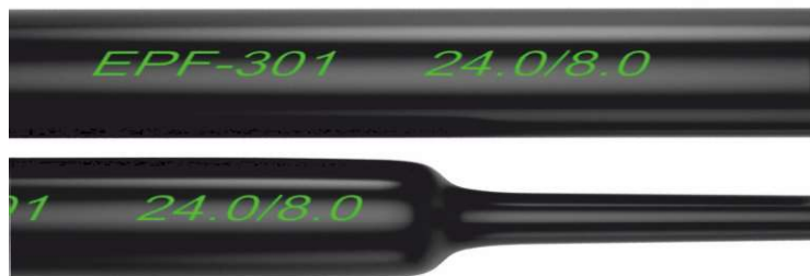
Tabela przedstawia rozmiary typowe. Inne rozmiary dostępne są na zapytanie. Typical sizes shown. Other sizes available upon request.