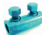
Tabela przedstawia rozmiary typowe. Inne rozmiary dostępne są na zapytanie. Typical sizes shown. Other sizes available upon request.